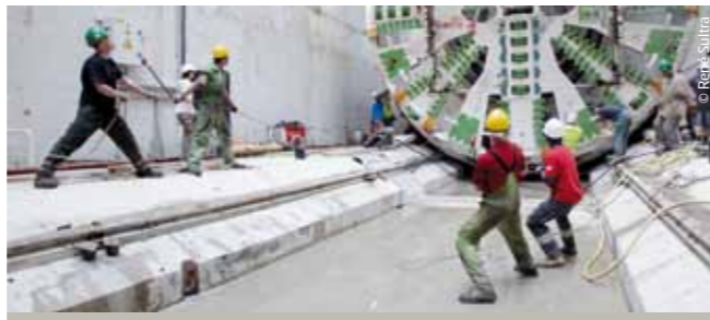
Les travaux du tunnelier permettront de limiter les impacts sur la ville.

Tout au long du chantier, les riverains, les commerçants, les usagers de la voirie et des transports publics seront régulièrement informés de l'avancement des travaux, des perturbations et des mesures d'accompagnement mises en place.