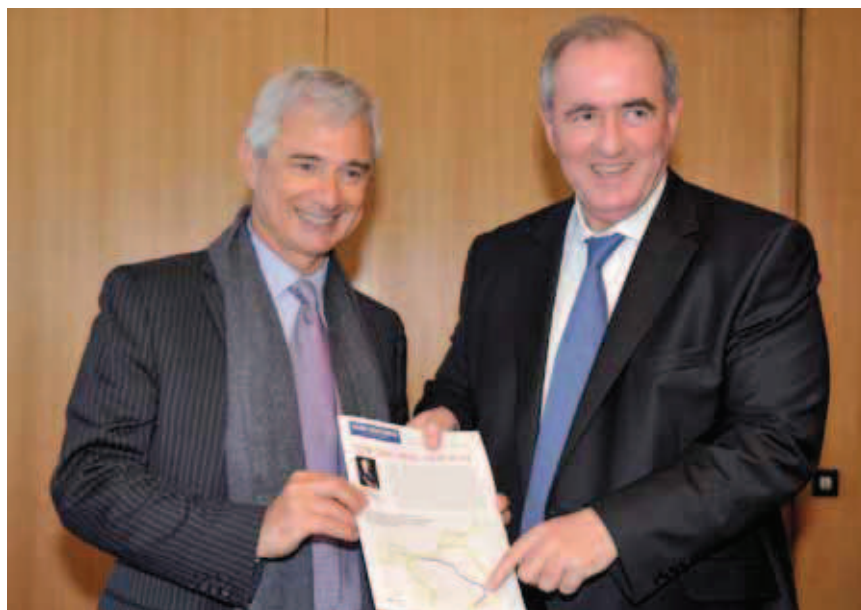
Claude Bartolone, président du Conseil général et député de la Seine-Saint-Denis et le ministre de la Ville Maurice Leroy, d'accord sur le tracé du Grand Paris Express.