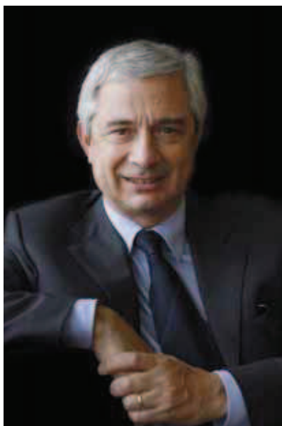
CLAUDE BARTOLONE, PRÉSIDENT DU CONSEIL GÉNÉRAL, DÉPUTÉ DE LA SEINE-SAINT-DENIS.