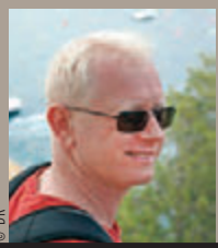
Jean-Noël Arbez champion paralympique*