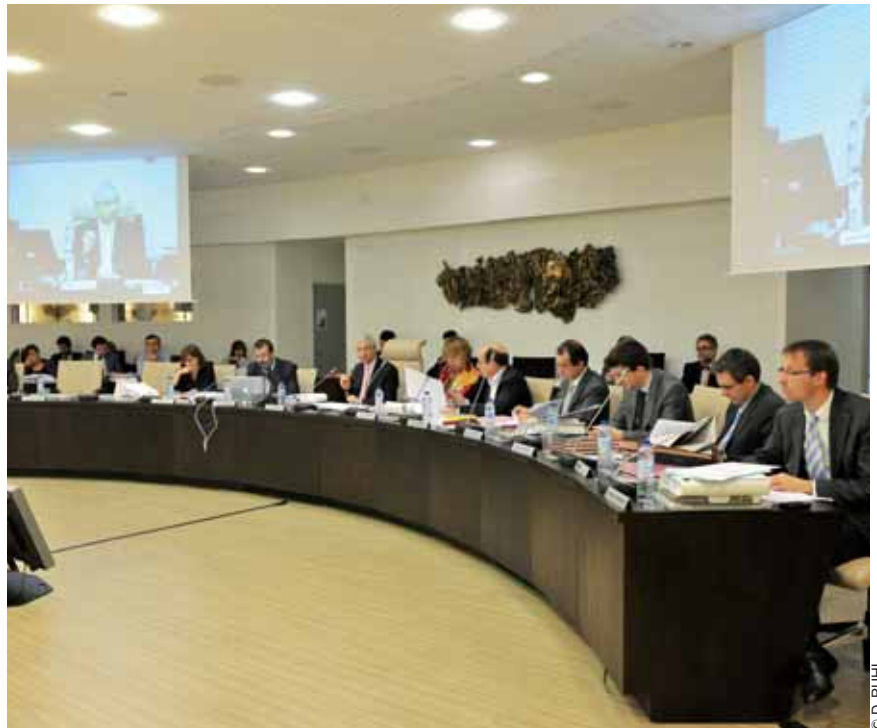
L'Assemblée départementale s'est prononcée le jeudi 18 novembre en faveur de la réalisation d'une double boucle de transports en commun.

Mais ni l'un ni l'autre n'ont encore déterminé leur tracé en Seine-Saint-Denis et l'heure est au débat public. Le jeudi 18 novembre, le Conseil général s'est déclaré en faveur de la réalisation des deux