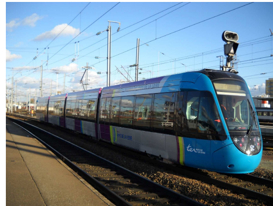
Tram-train Nantes/Clisson (SNCF, 2012)