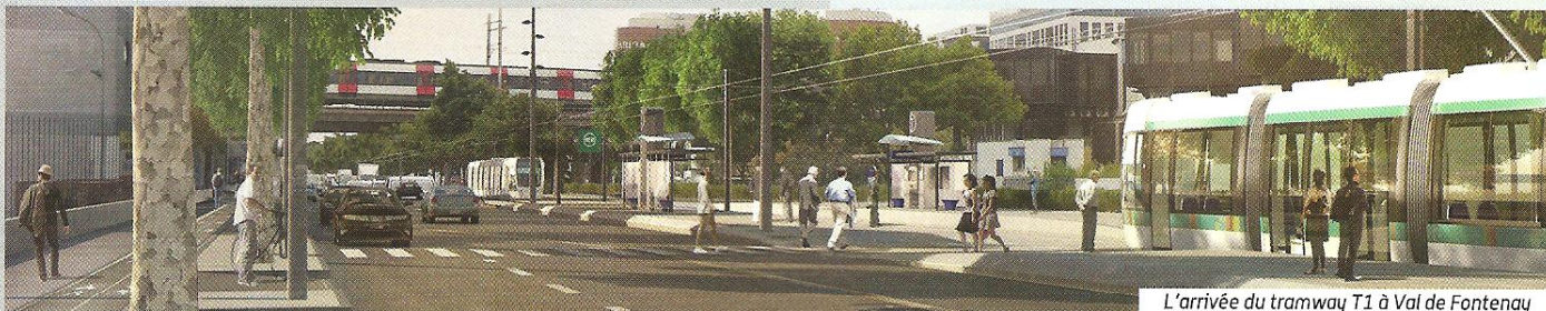
L'arrivée du tramway T1 à Val de Fontenay