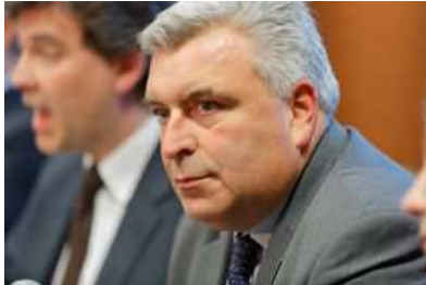
Frédéric Cuvillier.

Fin du suspense. Frédéric Cuvillier rempile. Il a été nommé secrétaire d'Etat aux transports, à la mer et à la pêche, sous la tutelle de Ségolène Royal, ministre de l'écologie, du développement durable et de l'énergie.