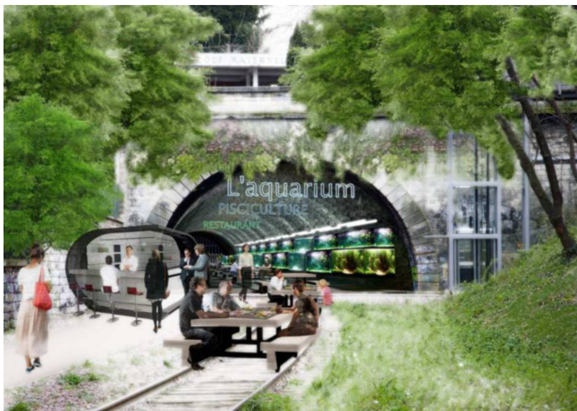
Si elle est élue, Anne Hidalgo veut poursuivre l'aménagement de la petite ceinture mais surtout sans constructions. « Je veux qu'elle conserve sa vocation de poumon vert. »