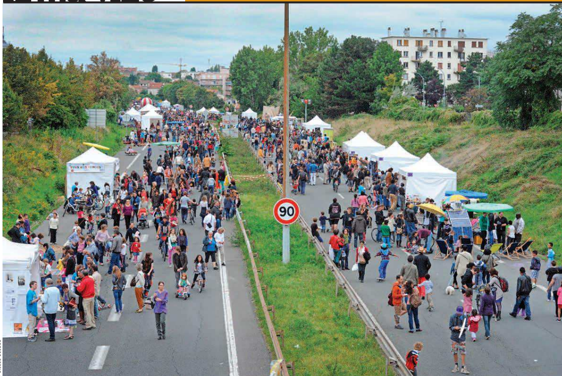
Si les premiers coups de pioche sont attendus en 2014, la mise en service effective du tram T1 devrait intervenir fin 2017.

publique (DUP). Cette procédure administrative permet en effet de réaliser une opération d'aménagement à l'issue d'une enquête publique qui, dans ce cas présent, s'est déroulée entre le 17 juin et le 31 juillet dernier. Grâce au T1 - qui devrait aussi permettre à la ville de mieux respirer**, des milliers de Montreuillois auront ainsi un nouvel accès au réseau francilien. Cela intéressera a fortiori les 30 % de foyers du Haut-Montreuil, mal desservis par les transports en commun à l'heure actuelle. Ainsi, un habitant de la place Le Morillon sera prochainement à moins de vingt-cinq minutes de Bobigny ou de Châtelet-les-Halles. De la même manière, un résident du quartier des Ruffins pourra rejoindre la place Carnot de Romainville en dix minutes chrono. Et de là, il pourra, d'ici à fin 2019, récupérer la ligne 11 du métro prolongée.