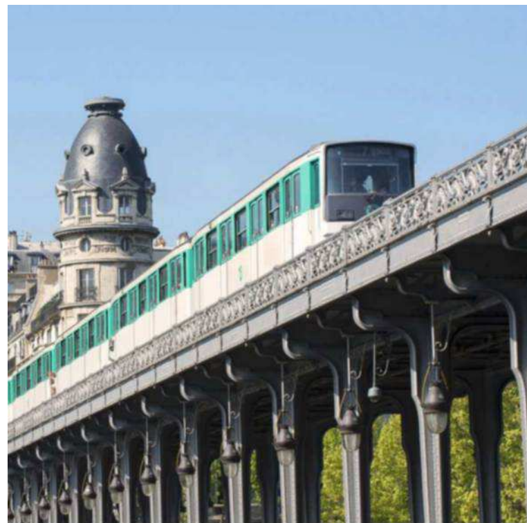
Construit entre 1903 et 1906, le viaduc supporte des charges de plus en plus importantes qui le mettent à mal.

Construit entre 1903 et 1906, le viaduc supporte des charges de plus en plus importantes. Son étanchéité a été mise à mal par l'augmentation du trafic. La corrosion gagne, elle, certaines parties métalliques. « Une réfection en profon-