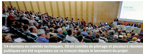
54 réunions en comités techniques, 38 en comités de pilotage et plusieurs réunions publiques ont été organisées sur ce tronçon depuis le lancement du projet.

Le positionnement du tracé, des gares et des ouvrages associés résulte d'une réflexion menée en concertation avec les collectivités locales et les autres acteurs concernés : STIF, services de l'État et opérateurs de transport.