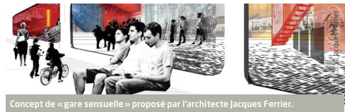
Concept de « gare sensorielle » proposé par l'architecte Jacques Ferrier.

Les gares du Grand Paris offriront à tous les voyageurs des espaces de transport à la fois efficaces et fonctionnels, sûrs et agréables. Les gares offriront des connexions avec l'ensemble des modes de transport, du Transilien à la marche à pied. Elles contribueront à améliorer la qualité de vie des habitants et des usagers en leur apportant des services et commerces complémentaires.