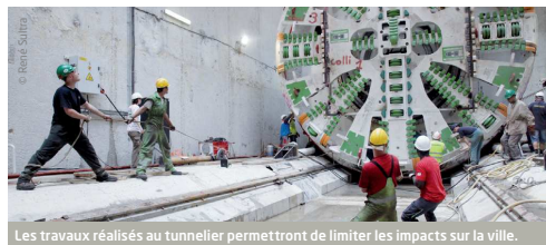
Les travaux réalisés au tunnelier permettront de limiter les impacts sur la ville.

Tout au long du chantier, les riverains, les commerçants, les usagers de la voirie et des transports publics seront régulièrement informés de l'avancement des travaux, des perturbations et des mesures d'accompagnement mises en place.