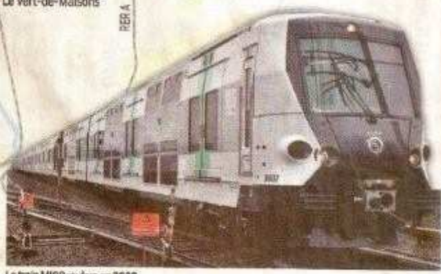
Le train MIO9 roulera en 2020.