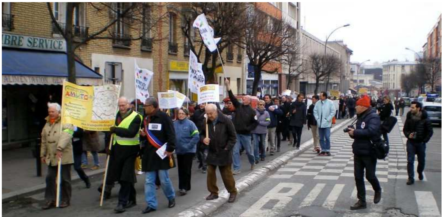
Pour le prolongement de la M9, marche du 6 avril de Mairie de Montreuil à l'Hôpital