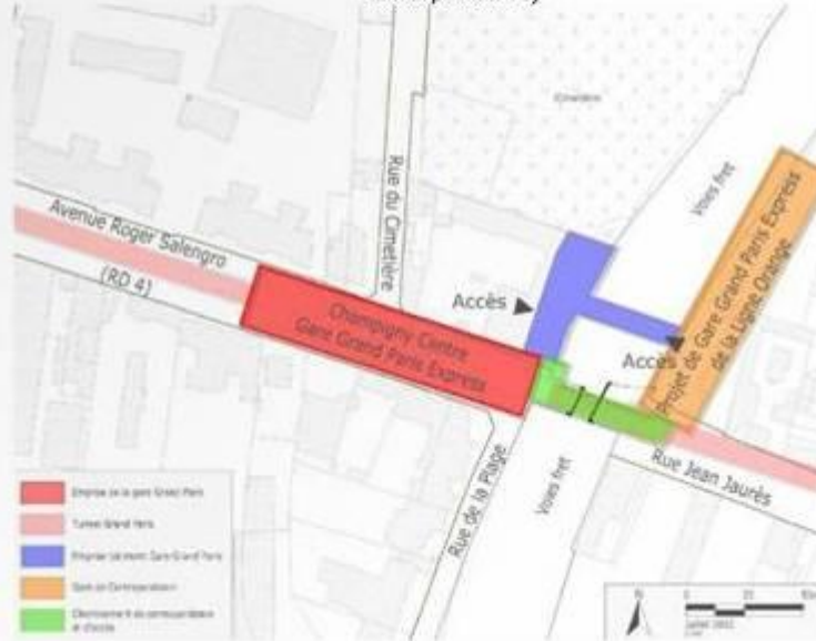
Figure 80 : Champigny Centre – Plan de situation (solution avec gare de la ligne orange en correspondance)

Dans cette configuration, la rocade M15 n'existe pas car les branches Sud et Est ne peuvent que se croiser à des étages différents !!!