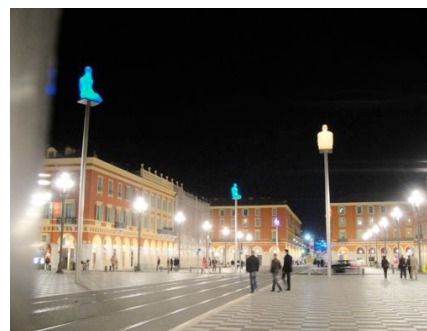
Nice, œuvre de Jaume Plensa sur la Place Masséna

Le Lieu du Design 74, rue du Fbg Saint-Antoine, 75012 Paris