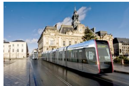
Tours, Place de l'Hôtel de Ville

C'est donc en France et par le vecteur du transport public, que la notion de "design urbain" aura connu un moment fondateur. Et, c'est désormais dans le monde entier que ce concept s'étend, porté par les bureaux d'études en ingénierie, les industriels, les opérateurs de transport, et les créateurs.