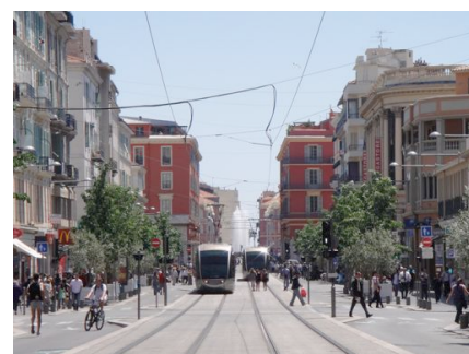
Nice, Avenue Jean Médecin