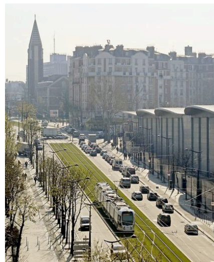
Paris, aménagement du Boulevard Lefebvre

Les tramways français présentent une valeur ajoutée qui s'appuie largement sur les métiers de la création : designers, urbanistes, architectes, artistes plasticiens. Ainsi, le projet de transport (véhicules, rails, lignes électriques, stations) s'enrichit des composantes suivantes : un design innovant et personnalisé pour le matériel roulant ; un aménagement de l'espace public autour des lignes, avec des paysages urbains parfois transfigurés (le Cours des 50 Otages à Nantes, les boulevards des Maréchaux à Paris, les quais de Bordeaux, ...) ; la création de stations emblématiques (L'Homme de fer à Strasbourg ; La Doua et Part-Dieu à Lyon, Mosson à Montpellier, ...) ; la conception d'une collection de mobilier urbain (Nantes, Lyon, Orléans, Rouen, Paris - Ile-de-France, ...) ; un accompagnement artistique et culturel ; de nouveaux systèmes d'informations voyageurs et d'identités visuelles.