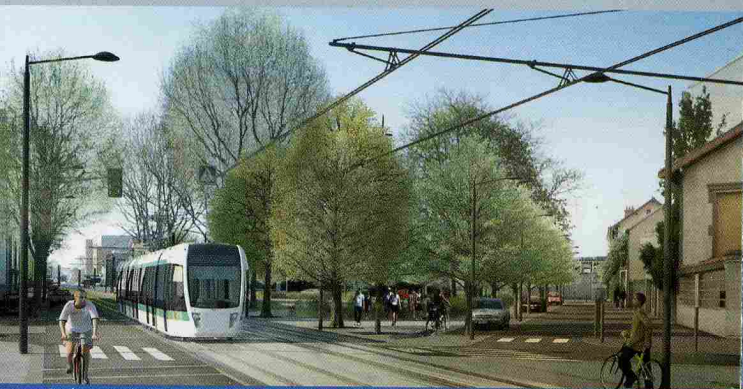
Aménagement du boulevard Barbusse à Romainville (vue non contractuelle)

L'arrivée du T1 permettra de compléter le réseau de transport en commun dans l'est francilien et d'améliorer le confort des voyageurs. Il offrira, à terme, des correspondances avec le T1 Asnières-les-Courtilles – Bobigny, les lignes 5, 11 et 15, le RER A, E, le T Zen 3 et sera complété par une réorganisation du réseau des bus.