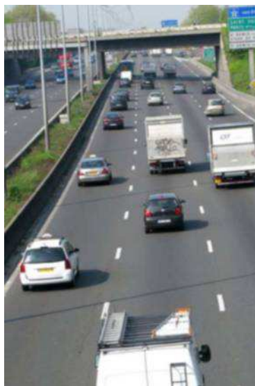
En 2009, une expérimentation menée avec les taxis avait déjà été organisée sur l'A 1.