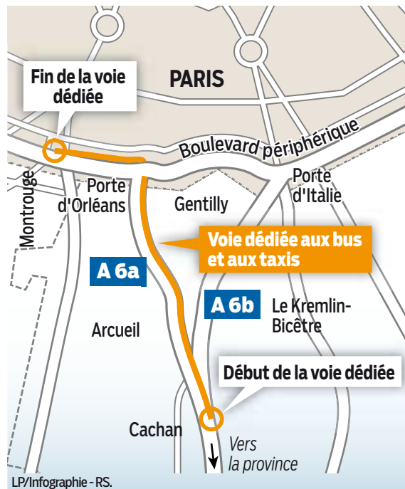
LP/Infographie - RS.

voie de gauche sera exclusivement réservée aux taxis et aux bus aux heures de pointe du matin. Soit entre 6 h 30 et 10 heures, sauf les week-ends, les jours fériés et les vacances scolaires. Sur l'autoroute A 6a, dans le sens province-Paris, c'est la voie de droite cette fois qui sera concernée, sur les 3 km avant d'arriver à la porte d'Orléans, au sud de Paris. Elle sera réservée aux taxis et aux bus