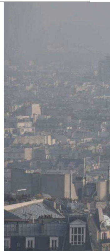
Paris, hier. Depuis la butte Montmartre, on apercevait à peine le Centre Georges-Pompidou.

Paris et l'Ile-de-France ne sont pas les seuls à subir un long épisode de pollution aux particules. Un grand quart nord-est du pays suffoque aussi avec quelques pics dans des villes du Sud-Ouest (voir notre infographie ci-contre). Hier, les régions Picardie, Lorraine et Rhône-Alpes, les départements du Nord, du Pas-de-Calais, de la Mame, du Bas-Rhin, du Doubs, de la Côte-d'Or, de l'Yonne, de l'Allier, du Cantal, du Puy-de-Dôme, de la Manche, du Calvados, du Loiret et de Charente ont dépassé le seuil d'alerte. Des mesures de réduction de la vitesse ont été prises dans les zones touchées, notamment à Strasbourg, particulièrement affecté par ce pic de pollution depuis jeudi. La métropole alsacienne a déclenché son propre plan Particules, avec incitation à l'utilisation des transports en commun et du vélo : des prix réduits, voire la gratuité pour les bus, et une limitation de la vitesse à 70 km/h sur les autoroutes. Les conditions météo, vent de nord-est et anticyclone, seraient en partie responsables de cette pollution en diffusant des polluants venus d'Europe continentale, selon le ministère de l'Écologie, auxquels s'ajoutent des émissions de particules issues de la circulation routière, des épandages agricoles, de l'industrie et du chauffage. Une étude de l'INVS, menée sur dix-sept grandes villes françaises, montre ainsi qu'une augmentation de 10 microgrammes de particules fines (PM10) par mètre cube accroît la mortalité de 0,51 %.