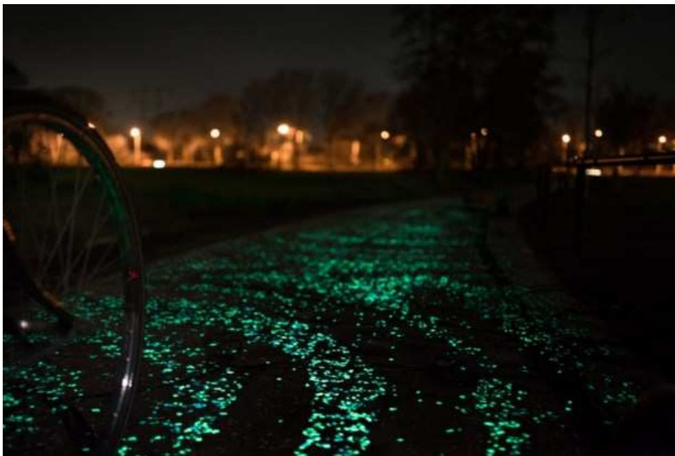
Une Piste Cyclable Phosphorescente aux Pays-Bas – Studio Roosegaarde

Cette initiative inédite, est le fruit de l'imagination du designer néerlandais Daan Roosegaarde, qui, à l'aide d'une peinture spéciale, a élaboré une piste cyclable phosphorescente d'un kilomètre, dans la ville de Nuenen.