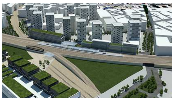
— Ensemble large entrée Nord de la gare. (image de la projection 3D).

Le Nord-est de la Capitale se transforme. Ainsi que le faisait remarquer François Dagnaud, maire du 19e arrondissement de Paris : « les voies de transports se mettent en place, s'inscrivant dans le réaménagement du quartier qui est en cours... Nous allons accueillir, début janvier 1700 salariés de BNP Paribas... »