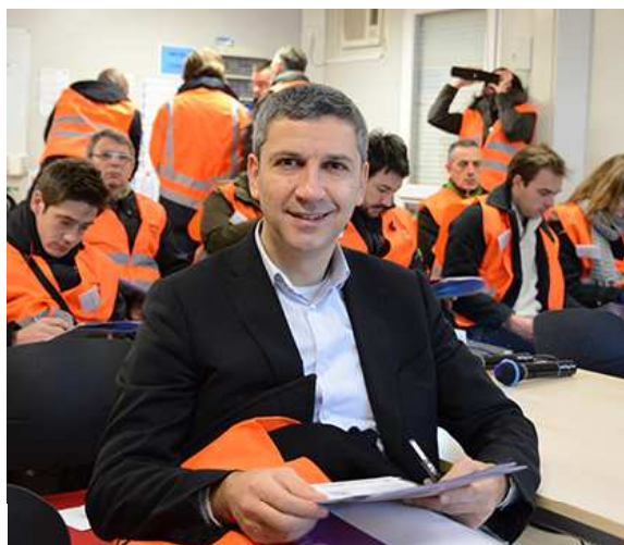
— Christophe Najdovski, adjoint à la Mairie de Paris, chargé des transports.