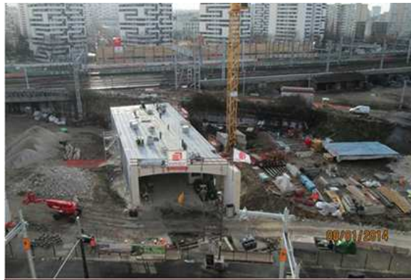
— Poussage du passage urbain (doc Rosa Parks).

Côté Macdonald un vaste parvis sera aménagé. Le projet de prolongement d'Eole (RER E) à l'ouest, offrira une liaison directe avec Mantes-La-Jolie, la ligne passant par la porte Maillot et La Défense qui sera ainsi à moins de 20 minutes.