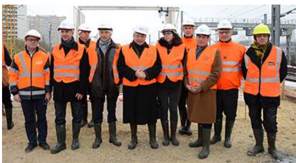
— Les personnalités présentes autour de Jean-Paul Huchon.