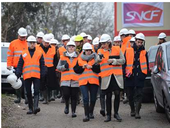
— En route pour la visite du chantier, le 3 décembre 2014.

Les Nautes de Paris participaient à une visite de chantier de la gare Rosa Parks (Paris 19e), le 3 décembre 2014 à un an de la mise en service de cette nouvelle gare.