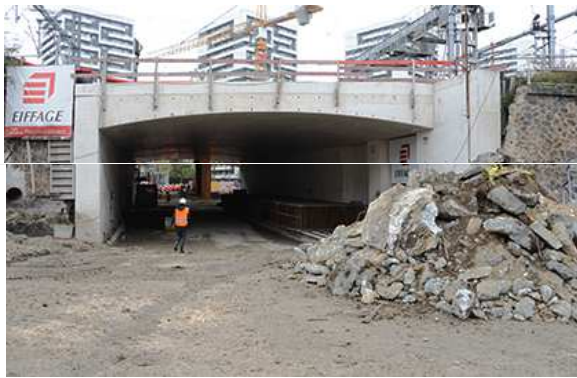
— Le passage public vu du côté Nord.

Côté Macdonald un vaste parvis sera aménagé. Le projet de prolongement d'Eole (RER E) à l'ouest, offrira une liaison directe avec Mantes-La-Jolie, la ligne passant par la porte Maillot et La Défense qui sera ainsi à moins de 20 minutes.