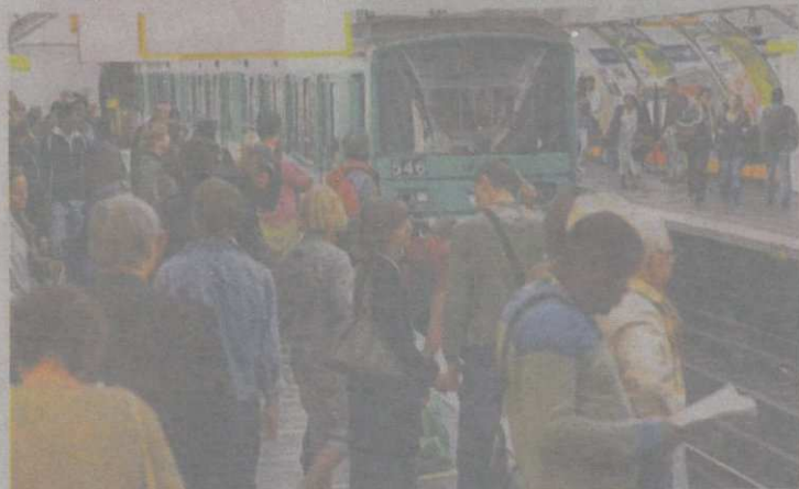
La Gare-du-Nord a vu plus de 51 millions d'usagers emprunter ses couloirs l'an dernier. A l'autre extrémité du classement, se trouvent une bonne partie des stations des lignes 3 bis et 7 bis, ainsi que celles de la boucle de la ligne 10.

LA RATP a récemment mis en ligne un classement des 303 stations de métro en fonction de leur fréquentation en 2014. Nous vous présentons ici la liste des dix stations les plus fréquentées et les dix qui voient le moins de passagers.