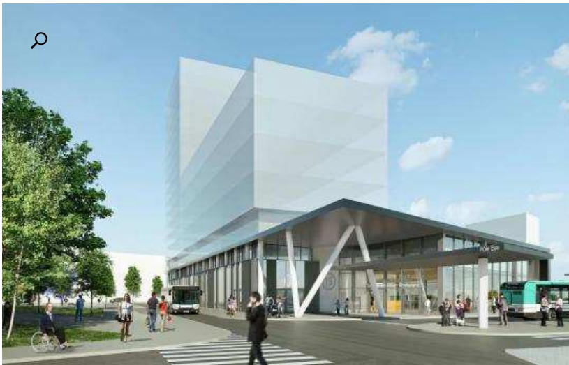
Illustration. La gare Bry-Villiers-Champigny du Grand Paris Express doit ouvrir fin 2022, mais la connexion prévue avec le RER E ne sera pas prête. (CABINET D ARCHITECTES RICHEZ ASSOCIES.)

Laure Parny | 13 Oct. 2015, 18h44 | MAJ : 13 Oct. 2015, 18h44