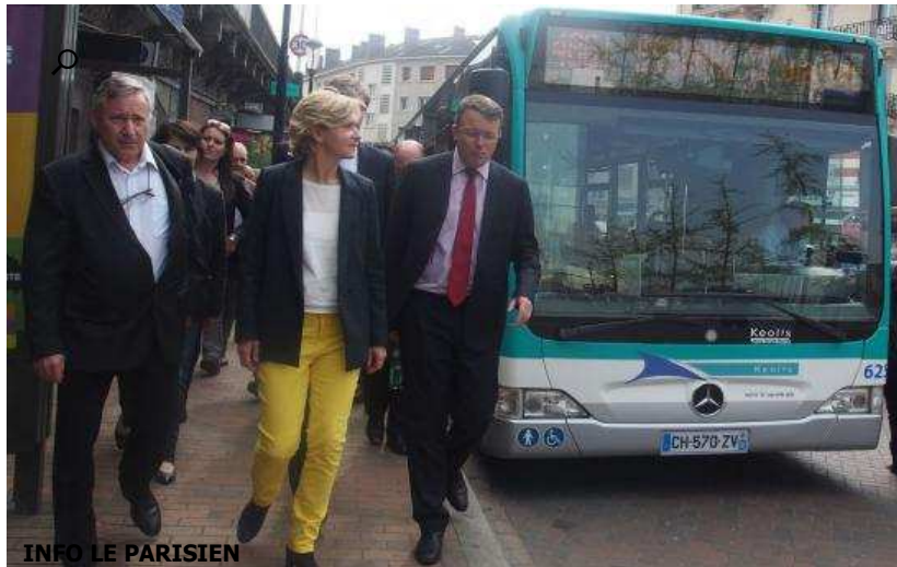
Juvisy (91) La candidate tête de liste LR-UDI-MODEM aux Régionales prône le développement du bus en Grande Couronne

Propos Recueillis Par Frédéric Choulet | 05 Oct. 2015, 19h32 | MAJ : 05 Oct. 2015, 19h54