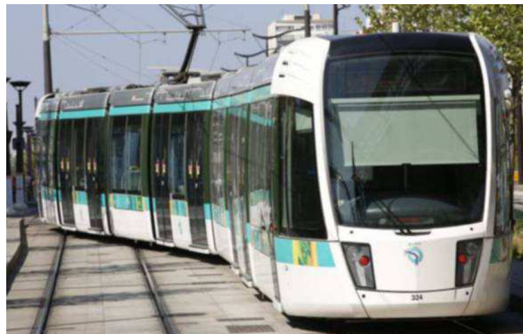
En moyenne, 250 000 voyageurs prennent le T3 chaque jour. Une fréquentation qui dépasse largement les prévisions.