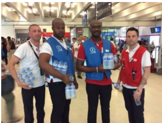
Des agents Transilien bénévoles distribuent des bouteilles d'eau en Gare du Nord à Paris.

Le Stif annonce que 100 000 bouteilles d'eau vont être distribuées, ce jeudi, dans les cinq principales gares parisiennes pour faire face à l'épisode de canicule, les transports en commun étant peu équipés de systèmes de climatisation ou de réfrigération.