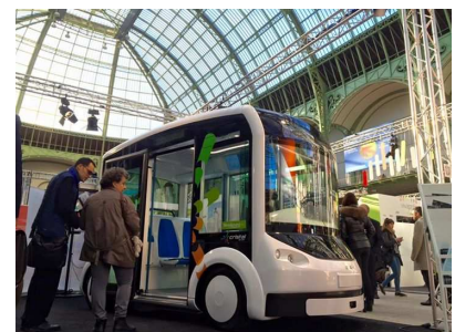
En savoir plus

Le premier démonstrateur interactif sera présent au Grand Palais à Paris du 4 au 10 décembre 2015 dans le cadre de la COP21 (Conférence mondiale sur le climat).