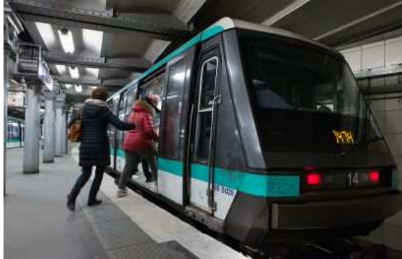
La RATP a prévu l'extension de plusieurs lignes de métro dont la 14 jusqu'à Mairie de Saint-Ouen.

Le conseil d'administration de la RATP, réuni le 27 novembre 2015, a approuvé un budget d'investissements de 1,77 milliard d'euros pour 2016, soit 26 millions de plus par rapport à 2015. Cette somme servira à l'extension, la modernisation et l'entretien du réseau francilien.