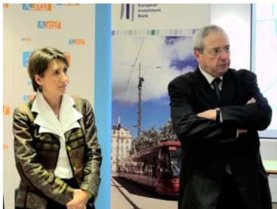
Sophie Mougard, directrice générale du Stif et Jean-Paul Huchon, président du Conseil du Stif et président de la région Île-de-France.

Sans surprise, le nouveau contrat entre le Syndicat des transports d'Île-de-France (Stif) et la RATP pour la période 2016-2020 a été signé le jeudi 5 novembre 2015. Ce sont ainsi plus de 11 milliards d'euros que le Stif versera à la RATP sur les cinq années de contrat pour réaliser les services de transports.