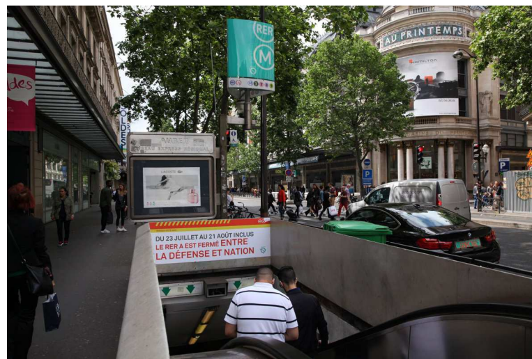
Boulevard Haussmann (IX e ), en 2015. Comme l'été dernier, la ligne ferme pour un vaste chantier de renouvellement du ballast, des voies et des aiguillages.

Informations sur le site Travaux-ete-rera.ratp.fr .