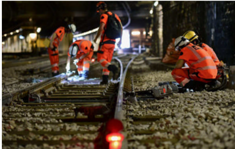
Jusqu'au 27 août, le RER C ferme à la circulation entre Austerlitz et Javel (branche ouest) et Avenue-Henri-Martin (branche nord). 300 agents se relaieront 24 heures sur 24.

« Outre ces travaux de confortement, on renouvelle les voies sur 1 000 m et on intervient sur les ga-