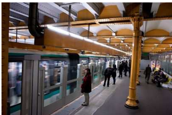
Le prolongement de la ligne 1 du métro à l'Est passera par Grands Pêchers.

Le Stif a présenté, le 19 octobre 2016, les conclusions des études menées depuis un an avec la RATP pour départager les deux tracés qui avaient émergé lors de la concertation avec le public. Le prolongement retenu pour la ligne 1 du métro à l'Est desservira les habitants de Montreuil et de Fontenay-sous-Bois. Désormais, le Stif va poursuivre les études permettant de réaliser le dossier d'enquête publique.