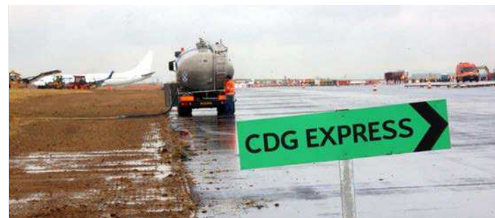
Aéroports de Paris a mené des travaux préparatoires à la future ligne CDG Express.

Après le vote des députés, il restera le Sénat, puis la validation, dans le budget de l'Etat, de la nouvelle taxe de 1 € sur les billets d'avion pour financer le projet, avant le lancement des travaux en 2018. « Le temps presse si l'on veut être prêt pour les JO 2024 », fait valoir ADP. En attendant, le chantier a déjà commencé. ADP a profité de la fermeture de la piste 2 de Roissy pour mener des « travaux préparatoires » (4,5 M€ tout de même) : une partie du tunnel qui servira à accueillir le CDG Express est en cours de construction.