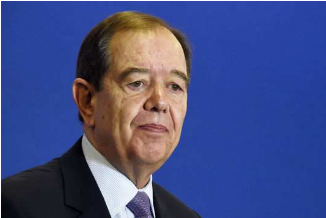
Patrick Ollier a été élu président du conseil de la métropole du Grand Paris, vendredi 22 janvier.

Voir aussi : Comprendre la Métropole du Grand Paris (/politique/visuel/2016/01/21/comprendre-la-metropole-du-grand-paris_4851238_823448.html)