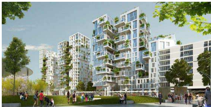
Visuel de synthèse d'un projet d'éco-quartier à Bagneux (Hauts-de-Seine). DR.

tout aussi importants : la transition énergétique, l'emploi, l'offre d'équipements sportifs ou culturels... La création des territoires, dans un premier temps, devrait déjà permettre de gommer certaines disparités, par