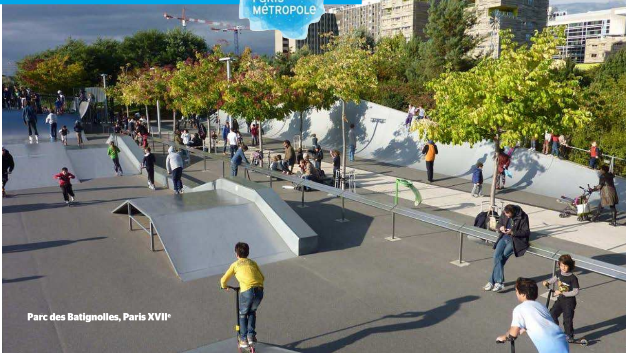
Parc des Batignolles, Paris XVII e