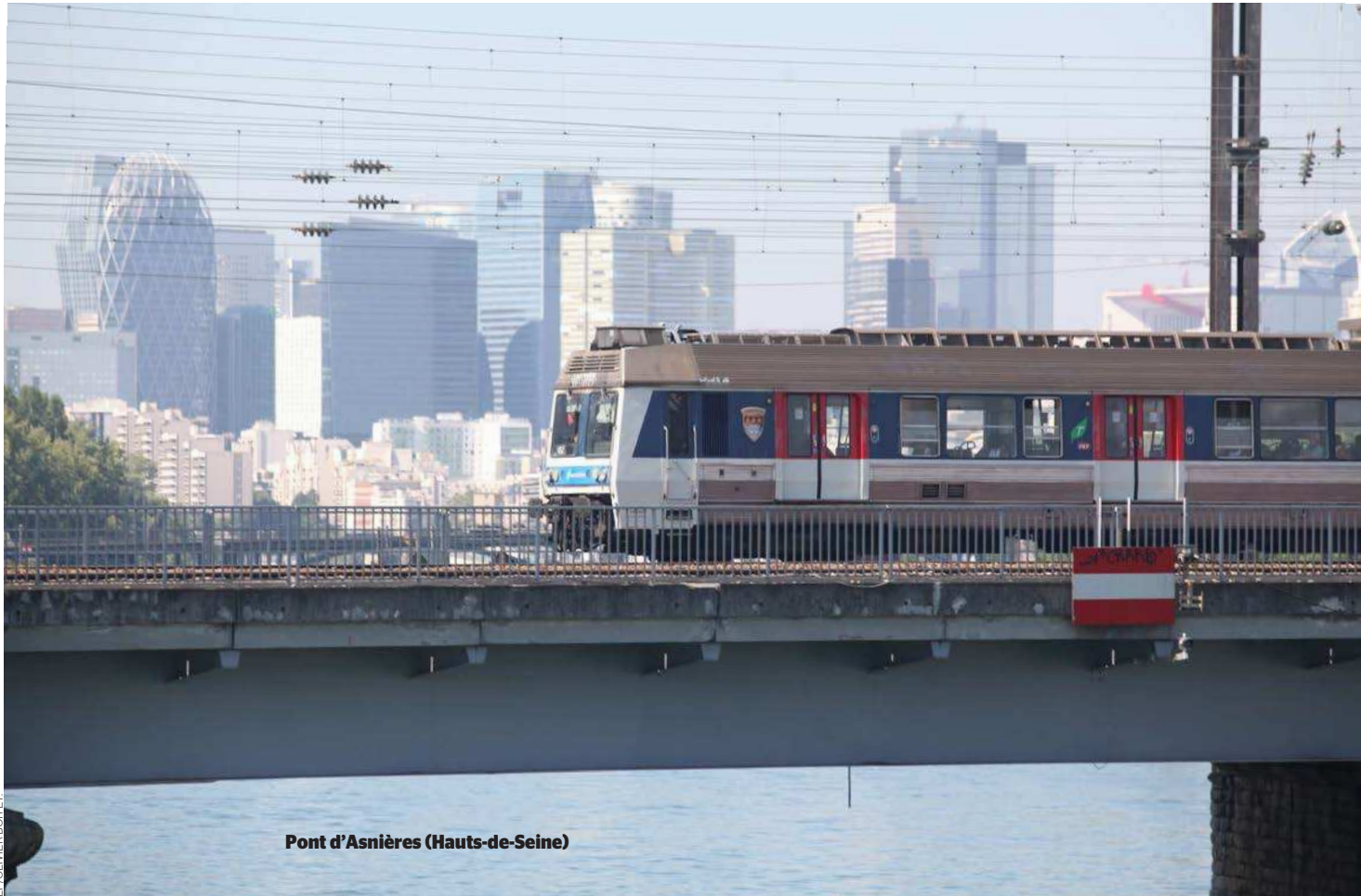
Pont d'Asnières (Hauts-de-Seine)