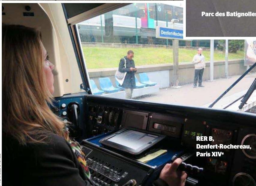
RER B, Denfert-Rochereau, Paris XIV e