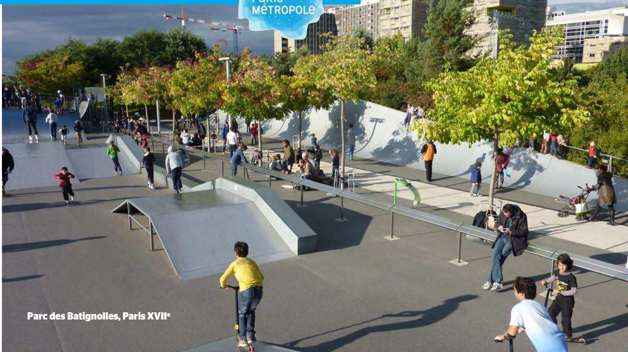
Parc des Batignolles, Paris XVII e