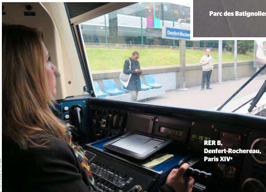
RER B, Denfert-Rochereau, Paris XIV e