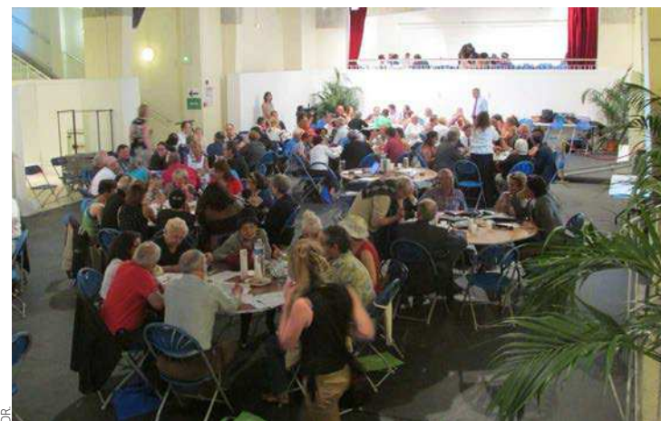
Consultation publique organisée à Colombes (Hauts-de-Seine) en 2015.

Ces institutions sont conçues comme des poupées gigognes : plusieurs communes forment un territoire. Actuellement, il y en a 12 au total (mais ce chiffre pourra augmenter à l'avenir au fur et à mesure de l'étalement de la métropole) au sein de la MGP. Chacun d'entre eux a le statut d'Établissement public territorial (ou EPT). Il compte entre 300 000 et 500 000 habitants, soit dix fois plus qu'une commune moyenne : cela permet d'aborder les problèmes de