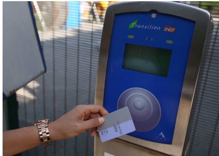
Utilisé par 3,8 millions d'usagers des transports franciliens, le passe Navigo va augmenter de plus de 4 %.