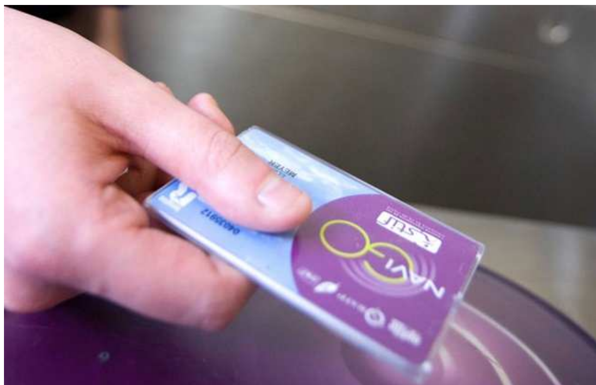
Illustration d'un passe Navigo.