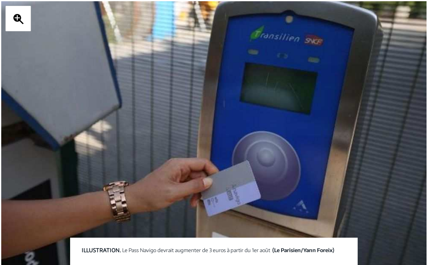
ILLUSTRATION. Le Pass Navigo devrait augmenter de 3 euros à partir du 1er août

🏠 > Île-de-France & Oise > Transports en Île-de-France & Oise | 27 juin 2016, 11h04 | MAJ : 27 juin 2016, 12h22 | f t c 45