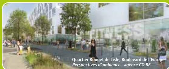
Quartier Rouget de Lisle, Boulevard de l'Europe Perspectives d'ambiance - agence CO BE

Ce tracé permettra également un accompagnement renforcé du développement urbain de Poissy, en desservant plusieurs projets urbains tels que le quartier Rouget de Lisle (ex ZAC EOLES) mais aussi des quartiers existants comme Saint-Exupéry.