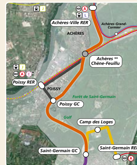
Les noms des stations sont provisoires.