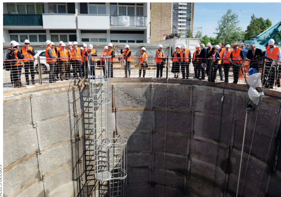
Les élus de l'APPL11 devant le premier puits de 20 mètres creusé en mai aux Lilas.

Is n'y croyaient plus... Et pourtant, les habitants de la Boissière sont désormais aux premières loges pour voir les travaux de prolongement de la ligne 11 avancer. À l'horizon 2022, Montreuil accueillera deux nouvelles stations, l'une située à côté de l'hôpital intercommunal André-Grégoire, la seconde rue de la Dhuis. Dans quelques années, il ne faudra plus qu'une vingtaine de minutes pour relier ce quartier de la ville au cœur de Paris, contre près d'une heure actuellement. Une vraie révolution pour les habitants qui empruntent quotidiennement les bus 102 et 129 pour rejoindre leurs lieux de travail. À l'image de Philippe, la soixantaine. Cet électricien de chantier passe en moyenne, chaque jour, 1 heure 30 dans les transports. « Le bus 102 est bondé. Parfois, j'hésite à remonter à pied, mais après une journée de travail, c'est difficile », explique-t-il. Le projet facilitera aussi l'accès à l'hôpital intercommunal qui n'est aujourd'hui desservi que par des bus. Boulevard de la Boissière, les travaux ont d'ailleurs commencé. Afin d'accueillir l'entrée de la station Montreuil-Hôpital, le local sécurité