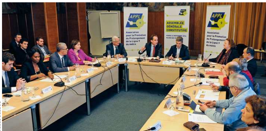
Huit communes, Est Ensemble et le conseil départemental sont désormais unis pour la ligne 9.