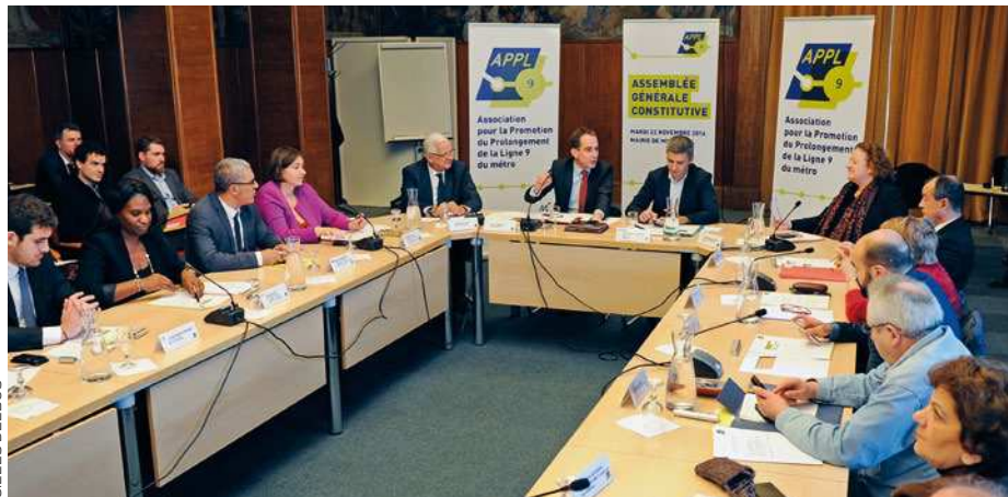
Huit communes, Est Ensemble et le conseil départemental sont désormais unis pour la ligne 9.