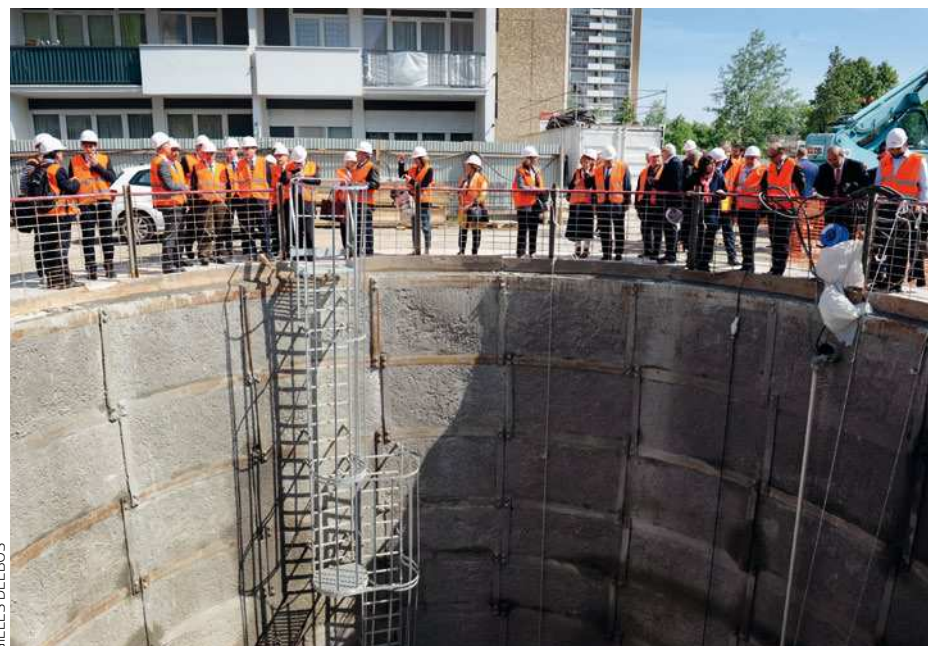
Les élus de l'APPL11 devant le premier puits de 20 mètres creusé en mai aux Lilas.

Is n'y croyaient plus... Et pourtant, les habitants de la Boissière sont désormais aux premières loges pour voir les travaux de prolongement de la ligne 11 avancer. À l'horizon 2022, Montreuil accueillera deux nouvelles stations, l'une située à côté de l'hôpital intercommunal André-Grégoire, la seconde rue de la Dhuis. Dans quelques années, il ne faudra plus qu'une vingtaine de minutes pour relier ce quartier de la ville au cœur de Paris, contre près d'une heure actuellement. Une vraie révolution pour les habitants qui empruntent quotidiennement les bus 102 et 129 pour rejoindre leurs lieux de travail. À l'image de Philippe, la soixantaine. Cet électricien de chantier passe en moyenne, chaque jour, 1 heure 30 dans les transports. « Le bus 102 est bondé. Parfois, j'hésite à remonter à pied, mais après une journée de travail, c'est difficile », explique-t-il. Le projet facilitera aussi l'accès à l'hôpital intercommunal qui n'est aujourd'hui desservi que par des bus. Boulevard de la Boissière, les travaux ont d'ailleurs commencé. Afin d'accueillir l'entrée de la station Montreuil-Hôpital, le local sécurité