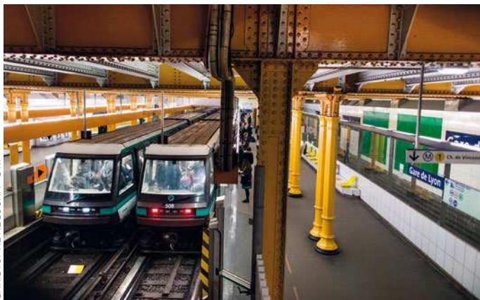
La gare de Lyon et le centre de Paris seront à portée de métro.

C'est fait ! La ligne 1 du métro passera par les Grands-Pêchers lorsqu'elle sera prolongée de Château-de-Vincennes à Val-de-Fontenay (voir Le Montreuillois n° 22). Avec cette arrivée prévue en 2030, « les gens viendront plus facilement à la piscine des Murs-à-Pêches et au stade des Grands-Pêchers », pronostique Niakaté, le gérant du restaurant La Source du Bel R. « Le commerce et l'artisanat vont aussi se développer car les transports ramènent toujours de l'activité. Résultat, il y aura du travail pour les habitants du quartier ! » Grâce à un important effort investi dans le programme de rénovation urbaine et sociale, le centre sportif Arthur-Ashe et l'IUT de Montreuil-Université Paris 8, le quartier ne manque pas