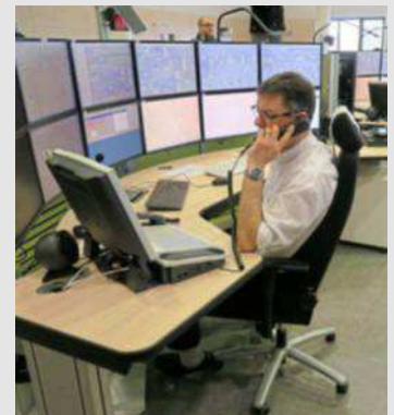
Vigneux-sur-Seine (91), lundi. Cette tour de contrôle remplace l'ancien poste d'aiguillage de la gare de Lyon, qui datait de 1933.