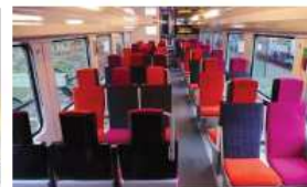
Les nouveaux trains ont des planchers bas qui faciliteront le déplacement des personnes à mobilité réduite.