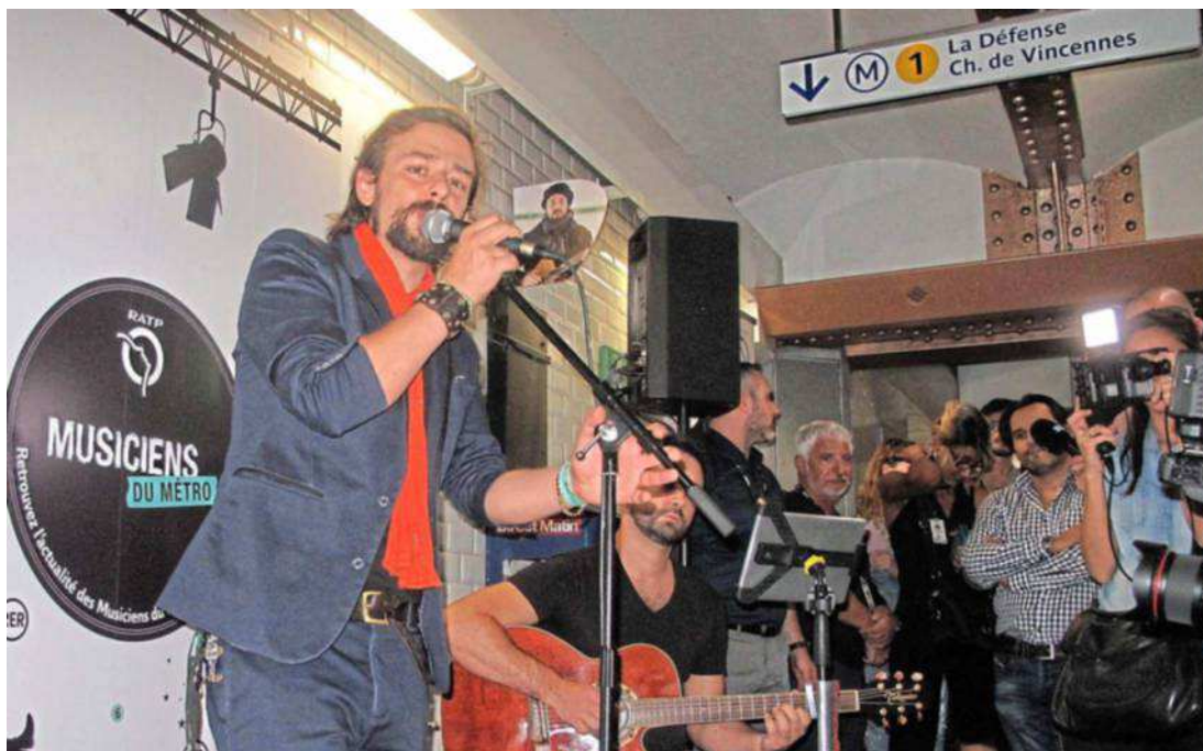
Clément Verzi, finaliste de « The Voice » 2016, était ensuite retourné faire des concerts aux stations Bastille et Gare de Lyon.

Pour son anniversaire, le label « les Musiciens du métro » de la RATP s'offre l'Olympia le 23 novembre pour un concert. Les votes sont ouverts demain, pour la Fête de la musique, afin de choisir cinq artistes qui s'y produiront.