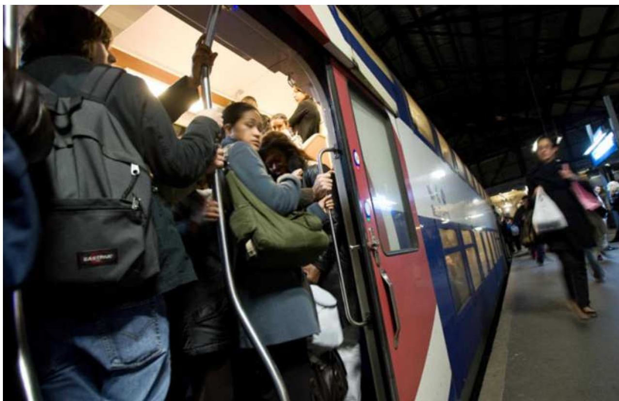
Illustration d'une rame bondée dans le RER B, en novembre 2009.