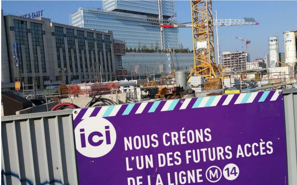
Porte de Clichy (Paris 17e). Les travaux sont toujours à l'arrêt suite à une inondation à la future station porte de Clichy sur la ligne 14. (LP/J.-G.B.)

D éjà dix mois de perdu ! Les travaux de prolongement de la ligne 14 du métro, entre Saint-Lazare et Mairie de Saint-Ouen, commencent à accumuler un retard qui inquiète. Pour la RATP, l'objectif est toujours de mettre en service ce prolongement en 2019, mais il n'est plus officiellement question du mois de juillet. Un chantier pourtant très attendu car les 5,8 km de ligne et les 4 stations supplémentaires doivent permettre de désaturer de 25% la ligne 13 surchargée. Actuellement, 3,5 km de tunnel a déjà été creusé par les deux tunneliers en service. Mais le problème vient de la construction d'une station, à Porte de Clichy.