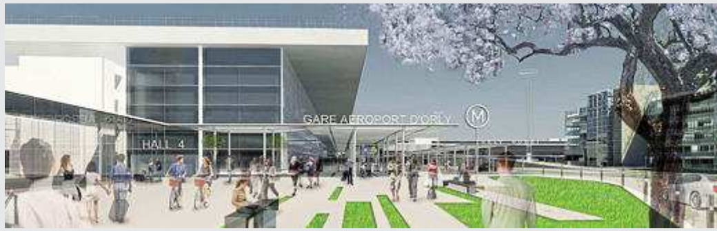
La gare des lignes 14 et 18 du métro à Orly sera érigée à la jonction des deux terminaux.

dans la rénovation de l'aéroport », explique-t-on chez ADP, qui construit la future station avec la Société du Grand Paris. Elle sera à 50 m des terminaux et reliée au terminus du tramway T7 à 500 m. A terme, cette station accueillera 95 000 voyageurs par jour. « Orly va devenir un nouveau hub de transports, se félicite Augustin de Romanet. Ce sera un petit Châtelet au sud de Paris. » J.-G.B.