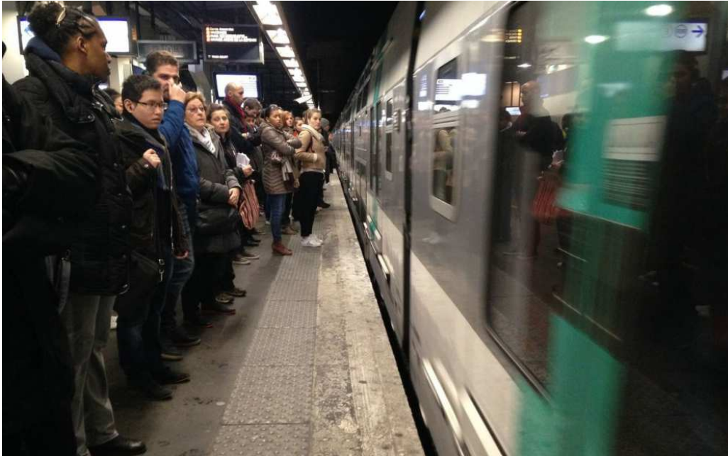
Val-de-Fontenay, le 10 novembre. Les usagers de la gare déjà saturée du Val-de-Fontenay attendent tous la construction de la ligne 15 Est du Grand Paris Express.

T out était sur les rails : tracé défini, enquête publique réalisée, avis du commissaire enquêteur positif... Rien ne semblait se mettre en travers du chemin de la ligne 15 Est du Grand Paris Express, entre Saint-Denis-Pleyel (Seine-Saint-Denis) et Champigny-centre (Val-de-Marne). La déclaration d'utilité publique, sésame au lancement des travaux, de la ligne devait être signée en février 2017. Mais c'était sans compter sur le coup de théâtre orchestrée par la présidente de la Région, qui a fait voter la semaine dernière un vœu au Syndicat des transports d'Ile-de-France (Stif) pour demander que la future ligne 15 Est desserve le centre de Drancy, comme le souhaite le maire de cette commune de Seine-Saint-Denis.